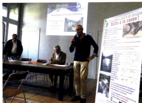
Réunion du 7 septembre 2019

- les chaussées et le miroir d'eau (la SAVSA a organisé une réunion-débat le 7 septembre