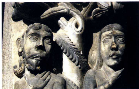
Détail de la sculpture d'Adam et Eve