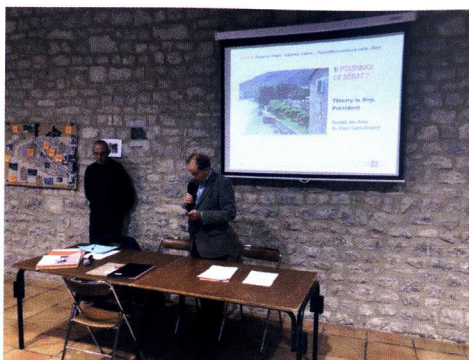
Réunion du 22 octobre 2019

Le dossier « place des Moines » évoqué dans ce numéro de notre bulletin, relève de la compétence communale. Les débats que nous avons organisés, en particulier la réunion-débat du 22 octobre 2019, en présence