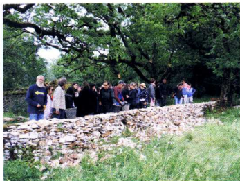
Murets avant et après restauration

L'équipe d'entretien des sentiers de randonneurs a ouvert un nouvel itinéraire entre Thoumet et Laussier. Cet itinéraire passe par le lieu-dit Bayle où se trouve une ferme ancienne (malheureusement à l'abandon).