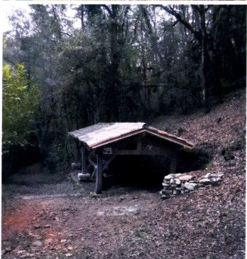
Le toit du lavoir avant et après restauration

La commune de Caylus, sur laquelle est situé ce lavoir, nous a fourni les matériaux et nous avons effectué les travaux en septembre et octobre 2019.