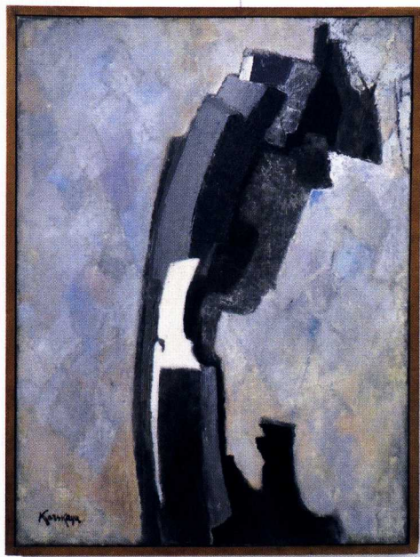
Oeuvre d'Ida Karskaya, lors de l'exposition de 2019, «Prémices d'une collection»

J'en viens au projet du CMN aujourd'hui. C'est le projet phare des trois prochaines années pour le Centre des Monuments Nationaux, qui gère pour l'État une centaine de