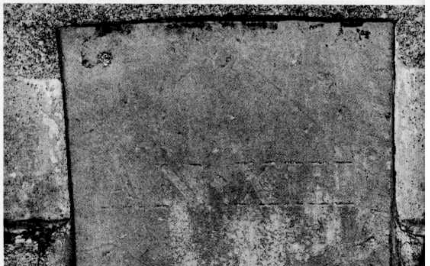
16, rue de la Pelisserie