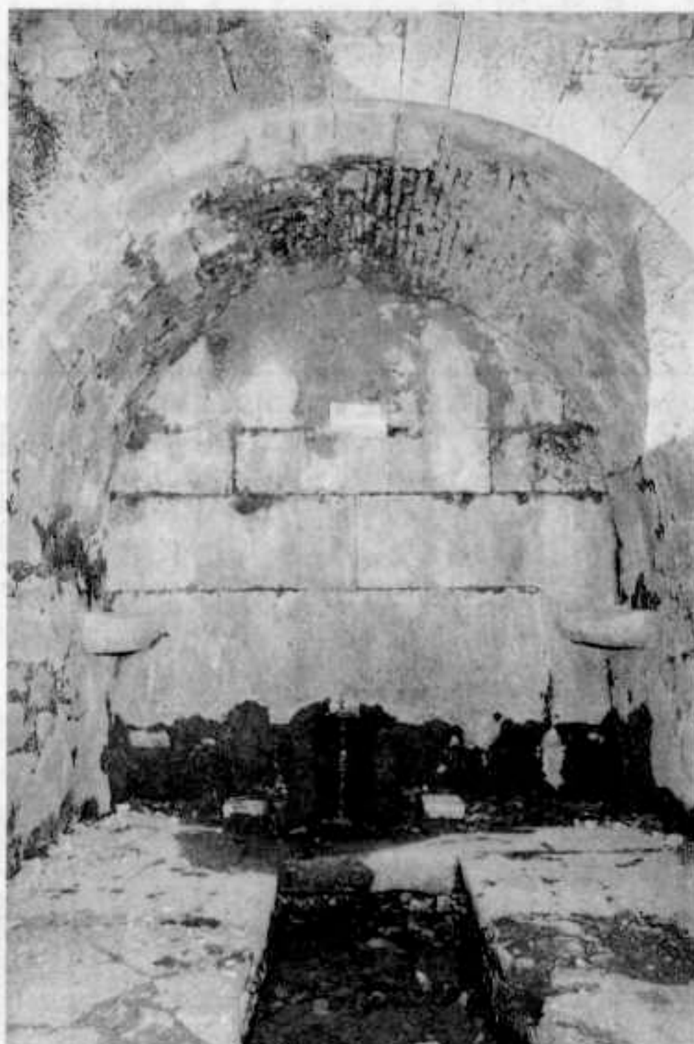
La Fontaine de Bouteilhou - BOTELHON vue de l'entrée du lavoir

Merci à vous toutes et tous et dites-nous ce que vous pensez de notre nouvelle organisation. N'hésitez pas à vous joindre à nous si l'une ou l'autre des activités que propose notre Société vous intéressent particulièrement.