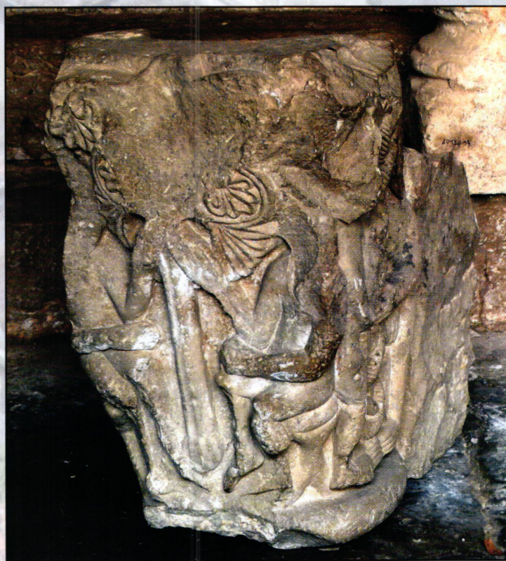
Photo du chapiteau signalé par L. Martial-Guilhem Voir article « Inventaire des Collections »