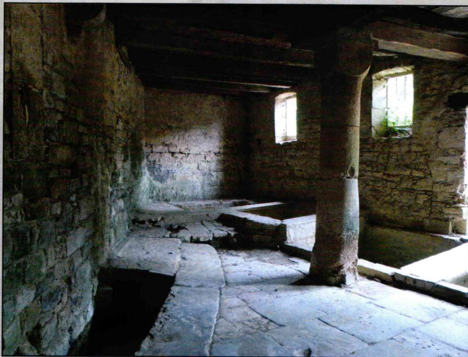
« Les Tanneries » XIV ème siècle