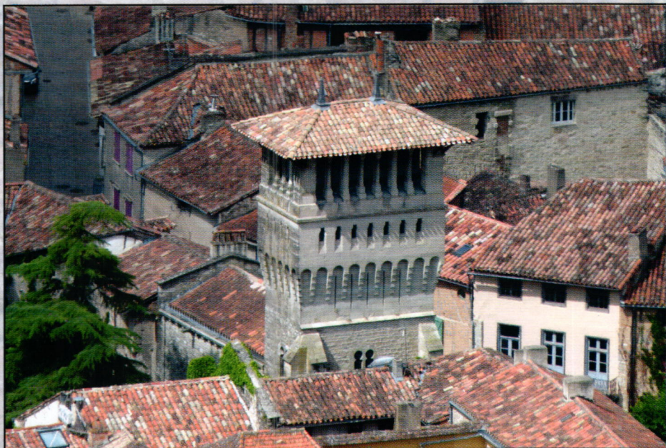
Maison Romane - Le Beffroi