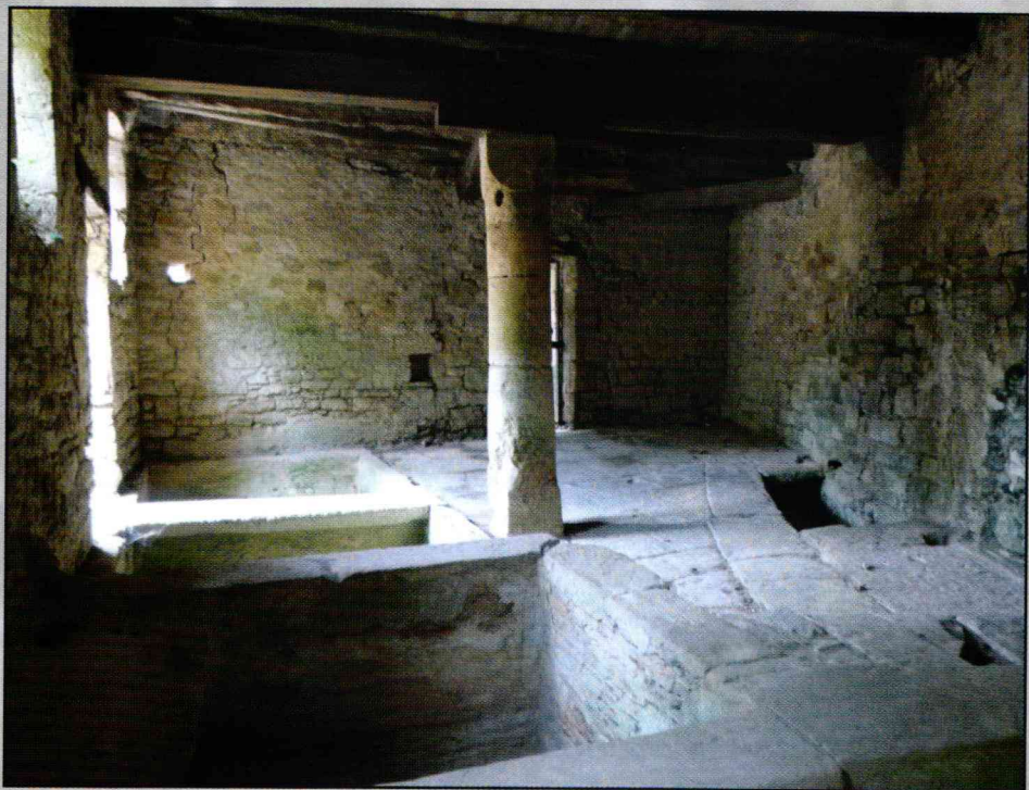
« Les Tanneries » XIV ème siècle