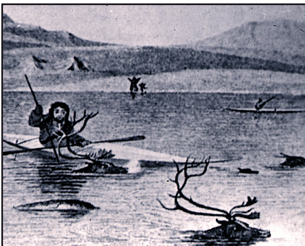
Chasse de rennes au harpon au Groenland. Illustration communiquée par G. Bosinski

■ [Darasse, Paul] [Porter, Gavin] [préhistoire] [Magdalénien] [Fontalès] [Saint-Antonin-Noble-Val] [Occitan] [Anglais]