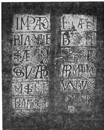
FIG. 2. — L'INSCRIPTION DE SAINT-ANTONIN, IMAGE DIGITALISÉE (procédé MacScan) d'après un cliché à l'infrarouge (C. N. R. S., U. A. 1009).