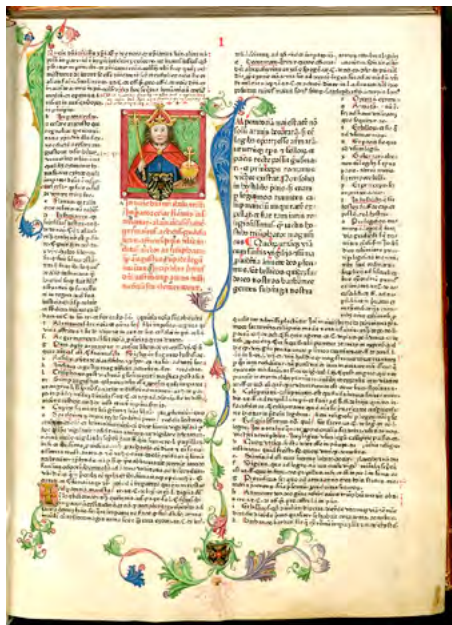
Édition des Institutes (commentés) de l'Empereur Justinien imprimée à Mayence en 1468 dans l'atelier Peter Schöffer (1425 - vers 1502) assistant de Johann Gutenberg. Ce livre aurait appartenu à Johan Fust, marchand et financier de Gutenberg.

Pour accéder à ce document, utilisez ce lien : Word Library https://www.wdl.org/en/item/18188/